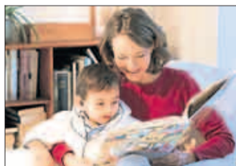
Kinder lieben Geschichten. Aber Unwahres erkennen sie schon früh